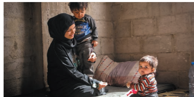
栄養支援を受けるシリアの親子

希望ある未来を確かにする事の重要性を訴えています。「彼らが成長し、やがて結婚し、子どもを育てる時が来ても、次の世代にもトラウマが引き継がれていきます。私たちはそれを多くの地域で目の当たりにしてきました。ワールド・ビジョンの役割の一つは、そうした連鎖を断ち切ることなのです」