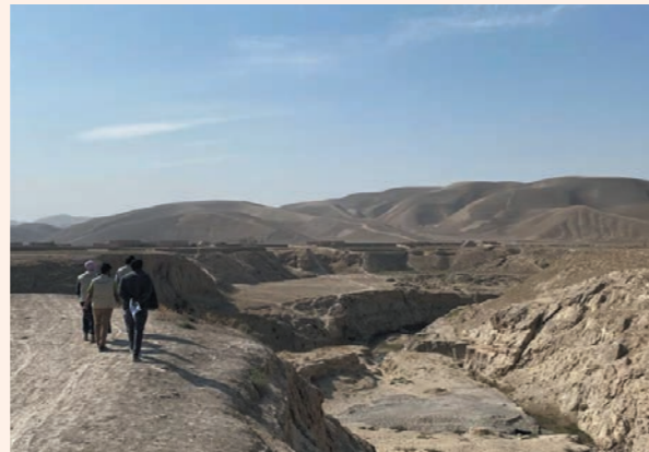
荒涼とした大地（水源視察）

一方で、厳しい制約や限られた資金の中でも、支援を途切れさせないよう試行錯誤を重ねながら活動を続ける、女性の同僚たちや診療所で働く女性スタッフの姿もありました。粘り強く支え続ける姿が印象に残っています。ニュースでは見えない、こうした一つひとつの営みが日常を支えているのだと感じました。