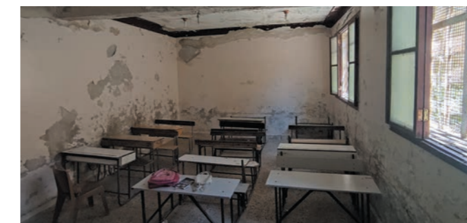
損傷し、使われなくなった教室（シリア北西部）

新学期の朝、ある村の壊れた校舎の周りに子どもたちが集まってきました。「もしかしたら学校が始まるかもしれない」と期待して、先生が来るのを待っていたのです。しかし、先生は現れませんでした。3日目の朝、子どもたちは諦めて学校へ来なくなりました。