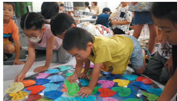
「水や食べ物があること、学校に行けることが当たり前ではないと思った」などの感想が参加者から寄せられました