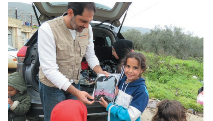
防寒具を受け取る子どもとWVスタッフ

レバノンでは、空爆が続き、3月の時点で、国民の約20%の100万人が避難する事態になっています。そのうち30万人は子どもです。ワールド・ビジョン・レバノンは、3月31日までに、5万人以上の子どもを含む約15万人に支援を届けました。温かい食事、毛布やマットレスと寝具、調理不要の食品、衛生キット、冬物衣料やストーブといった防寒キットなどの提供とともに、子どもたちや家族への心のケアや生活面のサポートも行っています。