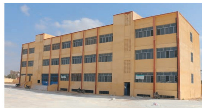
「マイルストーン・プロジェクト(1口100万円)」により修復されたシリアの学校。ご相続を機に、多くの方にご寄付先としてお選びいただいています