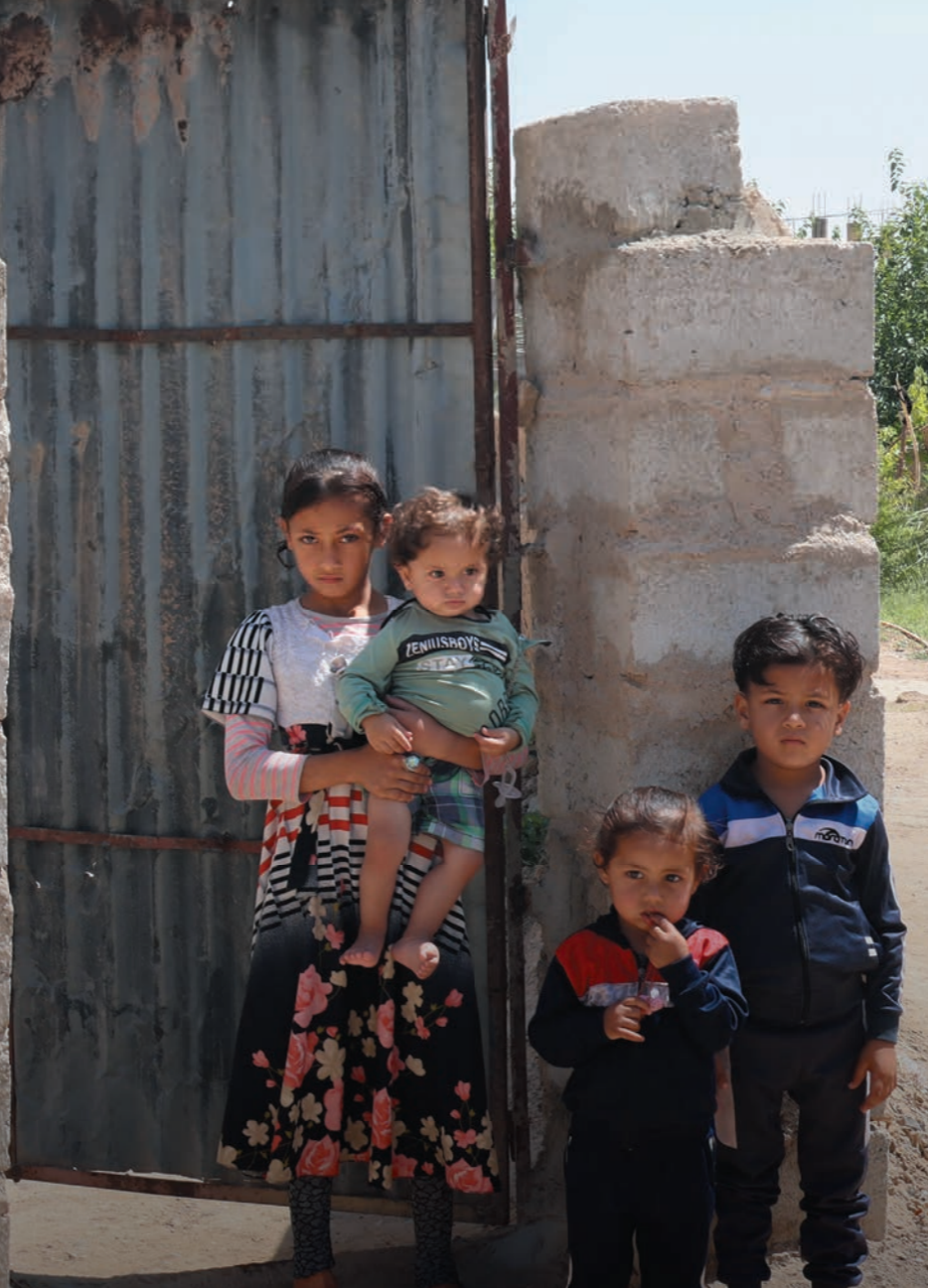
シリア北西部で、紛争で破壊された自宅の前にたずむ子どもたち

2月28日以降の情勢の急激な悪化を受けて、中東全域で暴力が拡大しています。いま、4500万人の中東地域の子どもたちが、命の危険にさらされています。