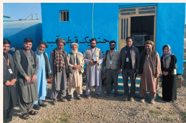
筆者（写真右、給水施設視察）

こうした活動が続けられているのは、日頃より支えてくださっている皆さまのおかげです。皆さまのご支援が、アフガニスタンの子どもたちとその家族の暮らしを支え、未来へとつながっています。改めて心より感謝申し上げます。