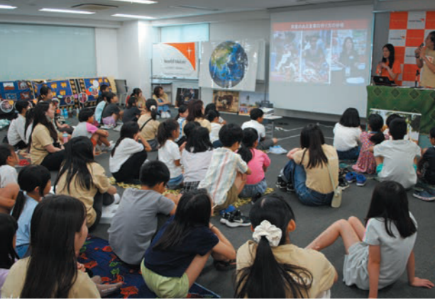
昨年のサマースクールの様子。定員を大幅に上回るお申し込みをいただきました

ワールド・ビジョン・ジャパン (WVJ) は、幅広い年齢層を対象に「グローバル教育」を実施しています。教育機関が展開している総合的な学習（探究）や国際理解教育、SDGs 学習等とも連携しています。