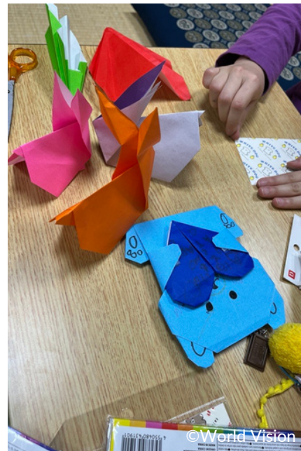
ウサギやクマ、紙ひこうきなど おりがみで色々なものを作りました