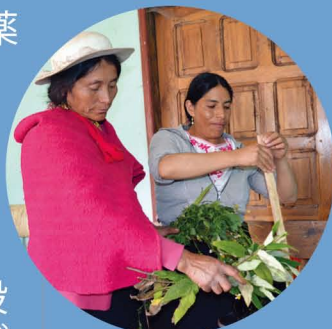
伝統的な治療法は、医療施設が不足する支援地域においては大きな助けになります

ブンガラ地域には、薬草を使った伝統的な治療法を知る人人(主に女性)がいますが、ADPはその知識を普及するための研修機会を設け、150人の親たちが薬草由来の石鹸やシャンプーを作る方法を学びました。