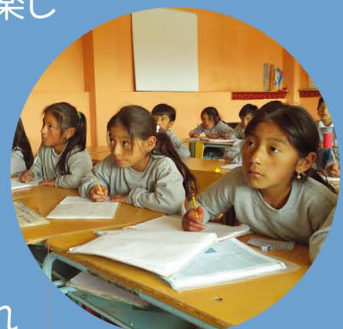
子どもたちは真剣な眼差しで授業に臨んでいます

※機能的識字能力:単なる文字の読み書き能力を超えて、家庭、コミュニティあるいは仕事場での、ある特定の目的のために、理解をもって読み書きができること。