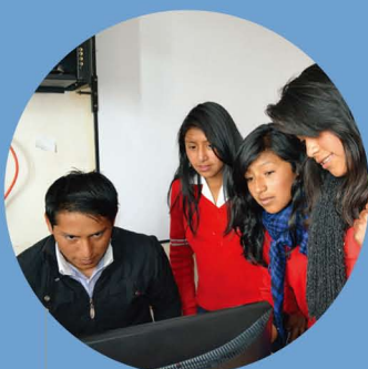
インターネットの正しい利用について学ぶ地元の高校生たち

またエクアドルでは、町に出れば簡単にインターネットに接続できるようになってきましたが、これから地元を離れ、町に出て行く可能性のある高校生にはインターネットの活用方法を教えるとともに、青少年に悪影響を与えかねないウェブサイトの存在やSNS (FacebookやTwitterなど) の使い方に対して注意喚起を行いました。