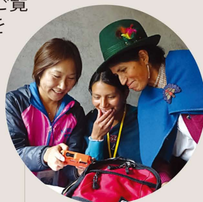
ツアーでチャイルドと対面したチャイルド・スポンサー

そのほか、2014年度はスポンサー・ツアーを実施し、支援者の皆さまにチャイルドと会い、エクアドルでの支援活動を直接ご覧いただく機会を持ちました。