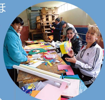
研修を受ける教師たち

ブンガラ地域では、ほぼすべての子どもたちが小学校に通うことができていますが、機能的識字能力(※)を満足に備えている子どもたち(10～12歳)の割合はまだ62%にとどまります。この状況を改善するために、ADPは支援地域内の83人の教師に対して子どもたちが楽しく効果的に読み書きを学べるよう教授法に関する研修を実施しました。886人の子どもたちには、その教授法に基づく教材が支給され、これから機能的識字率に向上が見られることが期待されます。