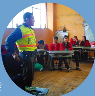
アルコールの持つ危険性について、子どもたちに強く訴える警察官

ブンガラ地域では、特に成人男性の間でアルコールの過剰摂取と、そこから派生した家庭内暴力や子どもの虐待が問題視されてきています。2014年度はADP初の試みとして、アルコール中毒や未成年による摂取といった問題に関して研修を行い、中学生、高校生とその親も含めた大人たちが参加しました。