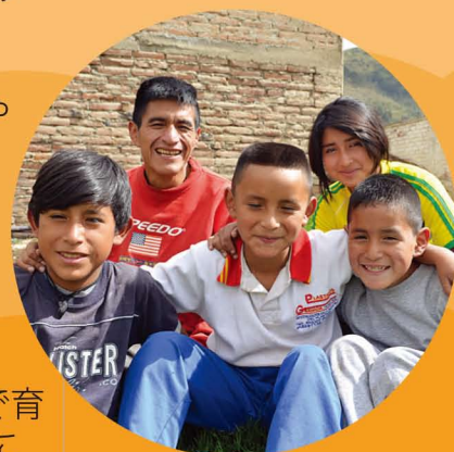
支援を受けて父親と兄弟とともに元気に暮らしています