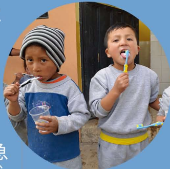
小さな頃から衛生管理を習慣化することが大切です

地方政府の保健局と協力し、5歳未満児を持つ親50人に対して、手洗い、うがい、歯磨きの大切さや支援地の子どもたちによく起こる急性下痢の予防法などに関する研修を行いました。家庭でこれらの衛生管理を習慣化し、幼い子どもたちの健康や命を守っていきます。