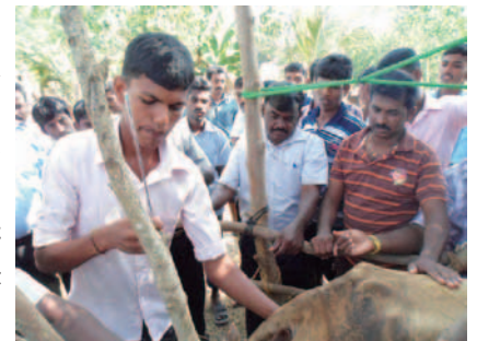
牛の人工授精の野外実習を行う普及員

選ばれた普及員は、2カ月間の技術研修を受け、4月11日に修了式を迎えました。研修では人工授精やワクチン接種などの実習、有機肥料や栄養豊富な飼料の作り方、家畜の病気の見分け方や予防法などを学びました。その他、リーダーシップ、公衆衛生や牛乳加工の技術、畜産農家向けの銀行ローンや保険についてなど、幅広く学びました。