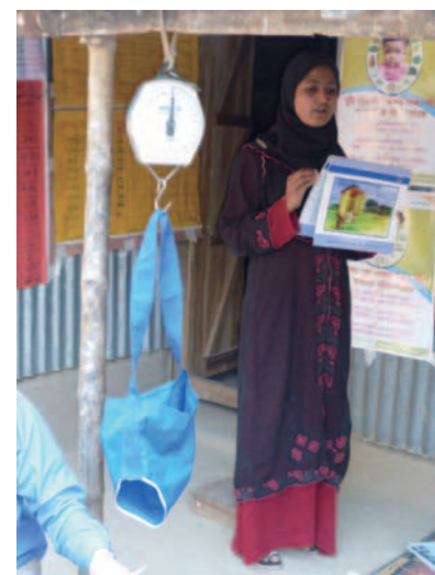
母子の健康についての説明をする専門家

支援活動の本格的な実施に先立ち、活動対象地域の子どもの栄養状態について調査し、年齢層ごとの栄養状態、対象となる子どもたちの人数を把握しました。また、ワールド・ビジョンスタッフとともに活動を実際に行う栄養改善促進員を、300世帯に一人ずつ選定し、促進員は、実際の栄養改善の方法や、栄養価の高い食事の調理方法などを実践していくために、12日間連続の集中的な研修を受けました。さらに、郡レベルの保健局や郡病院、農業局などとの情報交換や具体的な活動への協力など、今後のプロジェクト活動を進めていく上での密接な関係構築を進めています。