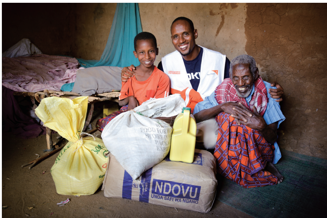
WVから食糧支援を受けた家族(ケニア)