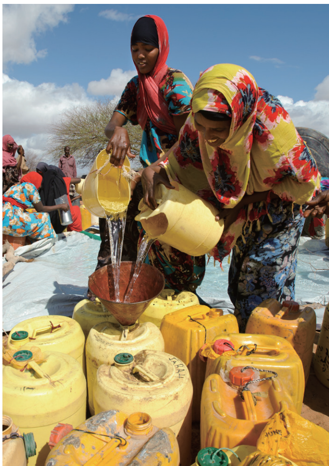
水の支援を受けた女性たち(ソマリア)