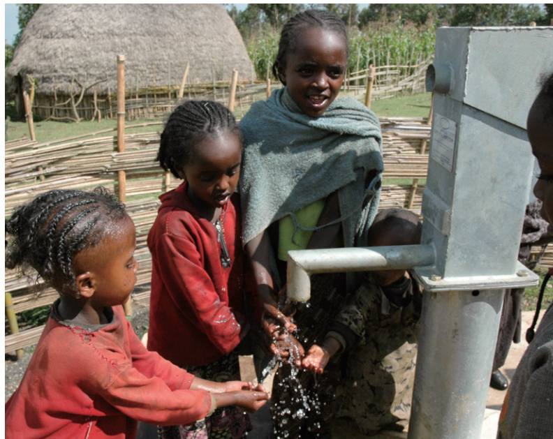
支援により作られた井戸で安全な水を飲む子どもたち(ケニア)

ソマリアにおいてはプトランドで、9万1,139人に対して給水や、母子保健所や小学校への水タンクの設置、トイレの設置や、石鹸の配布などを行うとともに、ソマリランドでも井戸の清掃や修復を実施し、1万2,022人が支援を受けました。