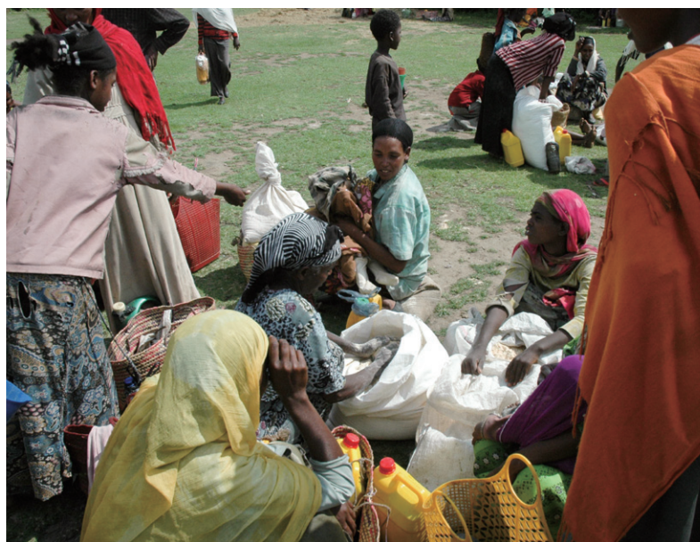
栄養不良の子どもたちや母親を支援するための栄養価の高い食糧を受け取る人々(エチオピア)