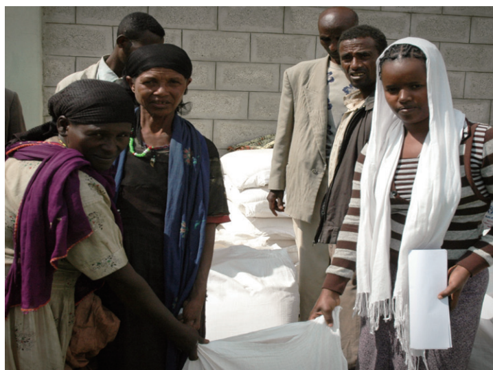
食糧を受け取った女性たち(エチオピア)