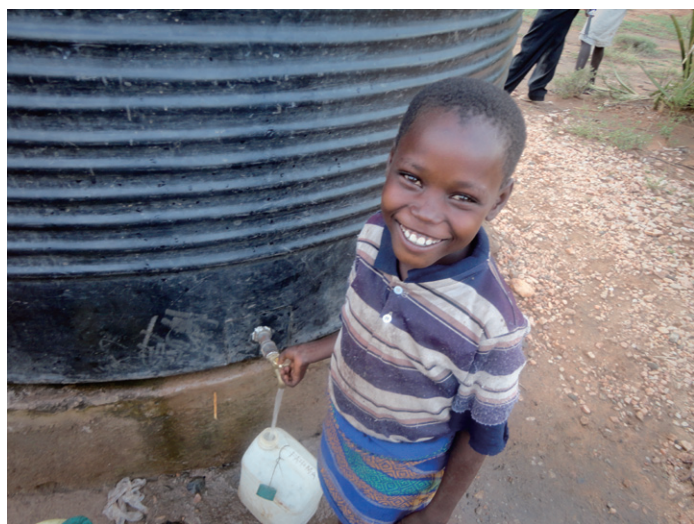
支援で設置された水タンクを喜ぶ子ども。これまで、水を手に入れるために学校を休まざるを得ませんでした(ケニア)