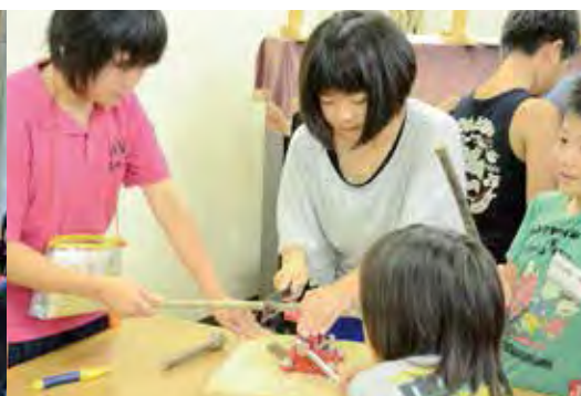
山形県庄内町と南三陸町の 小学生の交流会を手伝うMVCぶらんこ