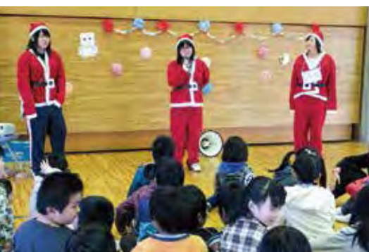
地域の子ども会の クリスマス会を盛り上げる MVCぶらんこ