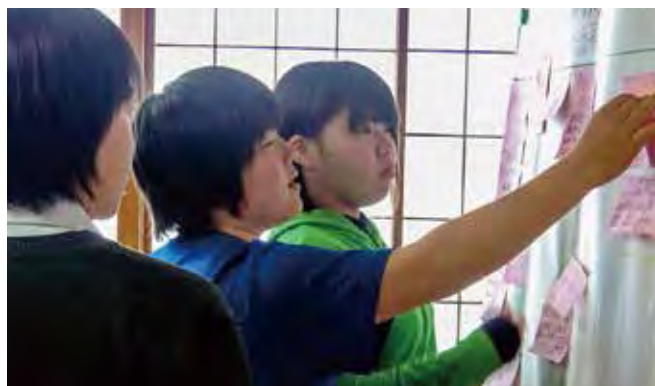
まちづくりプロジェクトの今後の活動について話し合うMVCぶらんこ

南三陸町まちづくりプロジェクトに取り組み始めてから、早いもので3年が経ちました。このプロジェクトに出会ってから、MVCぶらんこのメンバーの町への意識が変わりました。「自分たちにも町の復興ができるんだ」という意識です。「町民同士のつながり（多世代交流）を増やすために」JL自身が今できることは何かを考え、町民及び地域への貢献方法について自ら考えるようになりました。また、このプロジェクトを通じて、いろいろな人との出会いがあり、外との繋がりができ、JLの活動の幅も大きく広がりました。