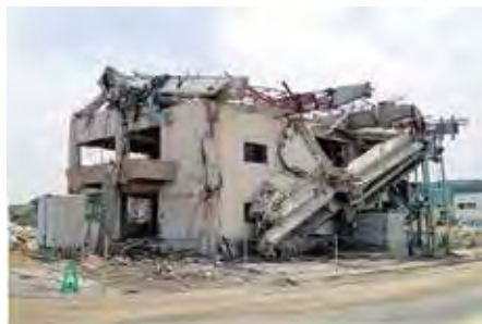
津波が襲来する様子