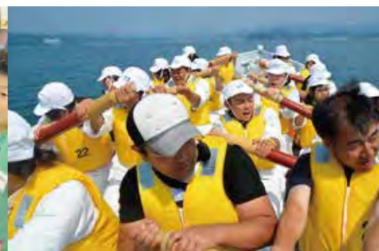
北海道本別町のジュニア・リーダーと ともに研修を行うMVCぶらんこ