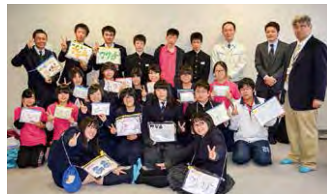
2014年4月、教育長に1年間の活動報告をした後のMVCぶらんこ

「子ども白書2014」（日本子どもを守る会：編）にも取り上げられ、日本中に活動の内容を発信することができました。町の復興を担う一員として、「MVCぶらんこが実行」することの実現に向けて、更なる進化を遂げ、「元気と明るさと笑顔」を提供できるように、日々努力して、自分たちにできることに取り組んでいきたいと思っています。