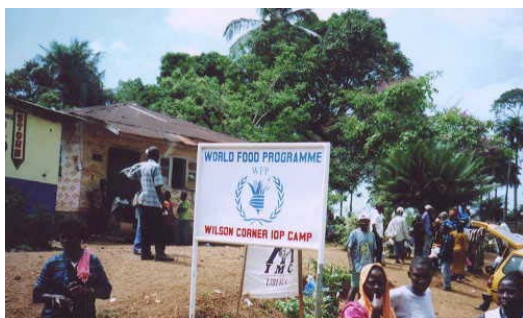
Wilson Corner IDP キャンプ入口。