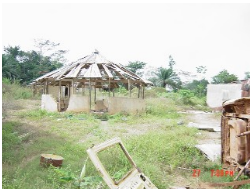
Nimba 州内での中心地。破壊されている住居

この地域全体は UNMIL に参加しているエチオピア軍（644人）が2週間前に入って治安維持を担当している。軍隊長は、この地域は治安が非常によく、地域住民も今では70%が帰還しており、その数は54,200人を超えているという。