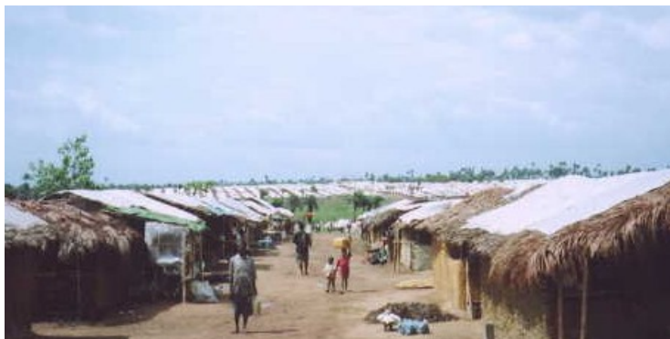
IDP キャンプの様子 (Wilson Corner IDP Camp)

国内避難民、難民の帰還に向け NGO の組織的支援活動がさらに促進される必要がある。水、トイレ、学校、シェルター、農具など、彼らの帰還に際して必要なもの・施設が早急に必要となっている。例えば、シェルターはトタン屋根のもので一戸 US$ 500 前後を想定している。セキュリティーに関して、殆んどに道路沿いの都市は Phase 4～5 となっているが、UNHCR は IDPs、難民の期間に備えて調査など必要な準備をすすめている。