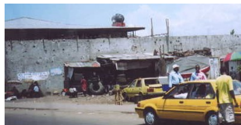
Free Port 周辺。壁などに銃弾の痕が今も残る。

モンロビアの中心地から近郊の IDP キャンプ群までは車で20分ほどで到着できる。途中、市内から郊外へ抜ける橋を巡って市街戦が繰り広げられた際に残された銃撃の跡が生々しく残っている Free Port (モンロビア近郊の港) を過ぎ、国内第二の規模といわれるマーケットを過ぎると IDP キャンプのある地域に到着することができる。途中いくつか UNMIL のチェックポイントがあり、多少の緊張感はあるものの道もきれいに舗装されたものが残っており、問題なく進むことができた。