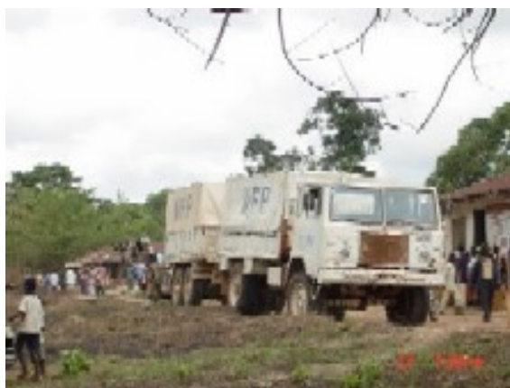
食糧配布のために Tappita にやってきた WFP トラック

また、この地域には病院・診療所などの保健衛生施設は一切存在していない。そこを出発しようとしていた時にひとりの妊婦が近づいてきた。出産予定日を過ぎており朝から少し陣痛が来ているが、ここには産婆さえもないので一番近くの施設まで車に乗せて行って欲しいとのことだった。我々はこの妊婦を小さな診療所連れて行ったが、そこに到着するまでの道のりは、足場の悪い道を車で約2時間であった。