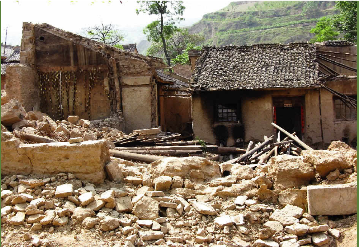
地震で廃墟となった村