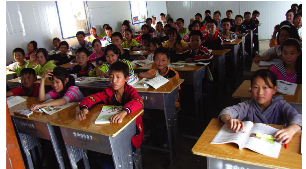
支援で建設されたプレハブ校舎で学ぶ子どもたち