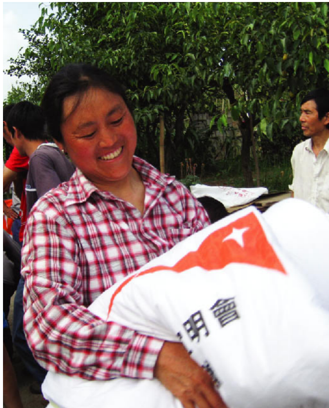
ワールド・ビジョンから食糧を受け取る被災者