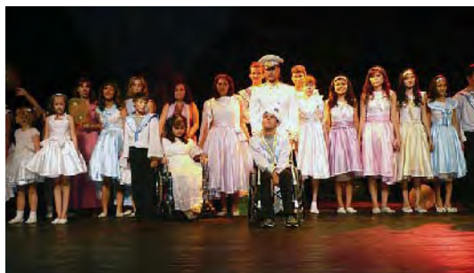
▲劇のようす ▼ 劇を観賞する来場者

今年度は家族・地域社会への啓発活動として、障がい児とその家族による演劇発表会を開催しました。ウズベキスタンの若手俳優や女優も参加し、当日は地域の人々260名が来場しました。この発表会は、障がい児たちにとって地域社会へ参加することの楽しさと自信を与え、家族や地域の人々にとっても、障がい児たちの持つ可能性を知り、彼らに対する意識を変化させる機会となりました。