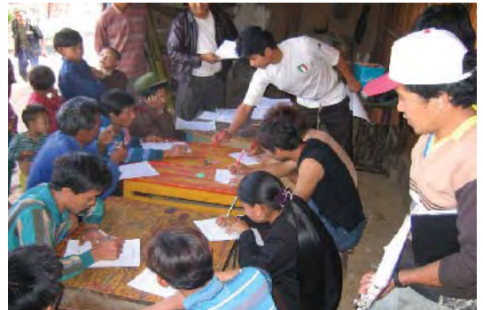
ボランティア・メンバーへの研修のようす

活動を地域に根付かせるため、地域の人々16人(男性11人、女性5人)がボランティアとして参加し、スタッフとともに中心となって活動を進めました。これらのメンバーに対しては活動に先立ち、保健衛生や栄養、結核、マラリア、HIV/エイズの予防とケアに関する研修を行いました。