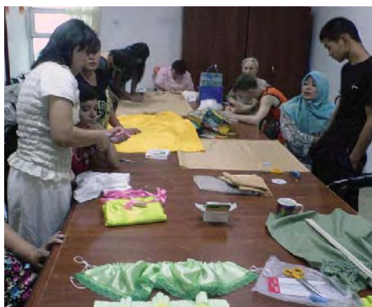
職業訓練（縫製クラス）に通う子どもたち

今年度は22名の障がい児たちが職業訓練を受講しました。また11名の障がい児たちに対して、普通高校の教師が施設で授業を行ってきました。現在では普通高校に通学しており、無事に高校卒業資格がとれる見込み