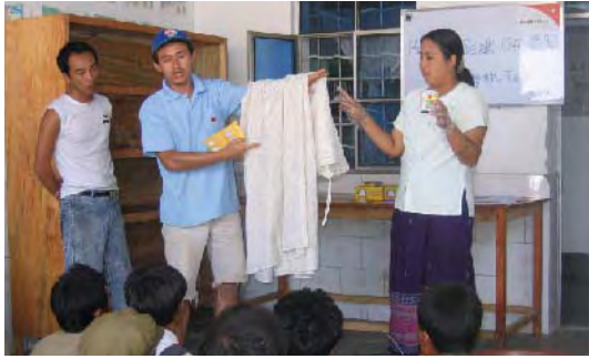
蚊帳の使用方法について、説明会を開催しました

養状態の悪い子どもには栄養価の高い食事を配給しただけでなく、母親が栄養価の高い食事を作れるよう実演指導を行い、指導した内容が実践されているか、家庭訪問によって確認しながら、定期的に子どもたちの健康診断を行っていきました。