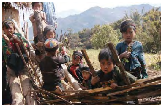
支援地の子どもたち

2村に「栄養改善センター」を設置し、5歳未満の全ての子どもの健康診断を行いました。その結果、栄