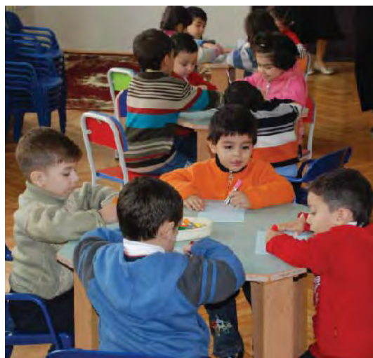
統合クラスの様子

今年度は8校に合計9つの統合クラスを設置し、新たに52人の障がい児たちが年齢に応じた普通学校に入学しました。また25人の教師が必要な研修を修了し、統合クラスで教えています。4年間の活動を通して、統合教育に参加した子どもたちのストーリーを集めた本も出版され、事業の成果が目に見える形で、教育省や学校、地域の人々の手に届いています。